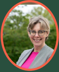
Martine Floor Specialist Leren en Ontwikkelen LTO Academie